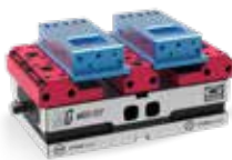
Serraggio doppio Double clamping