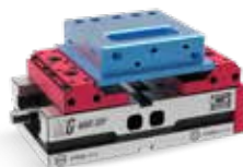
Serraggio singolo Single clamping