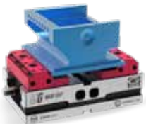
Serraggio autocentrante Self-clamping

The new MaxiGrip vise, this vise springs from the need of joining the highest clamping stability and the best use versatility in a single product. The possibility of shifting from the workholding of a single part to the double one, or to the self-centring modality immediately and intuitively, combined with the high compactness, make it the ideal product for the use on any machine kind, from 3 to 5 axes. To assure the best performances in time, the vise has been implemented with base body, slides and screw made of case-hardened, tempered and ground steel; bearings and gasket have been provided inside to improve its sliding and to maintain the correct lubrication of kinematic gears.